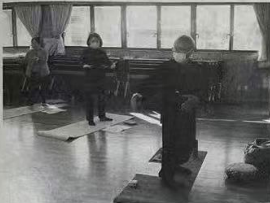
陰陽の特性を意識しながら体を動かす